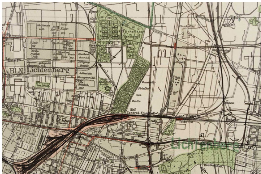
Figure 2: Projet Kartograph, 1938/2015 Berlin.