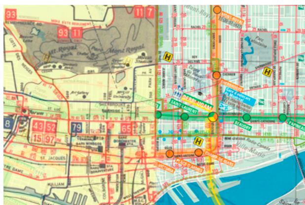
Figure 3: Montreal Transit Map 1941 vs 2011.

Anton Dubrau, spécialiste montréalais du transport en commun, des cartes et des applications numériques, propose sur son site des modélisations cartographiques pour des projets reliés la plupart du temps au transport en commun. Il a notamment réussi à superposer des cartes du transport en commun de Montréal en 1941 à celles d'aujourd'hui.