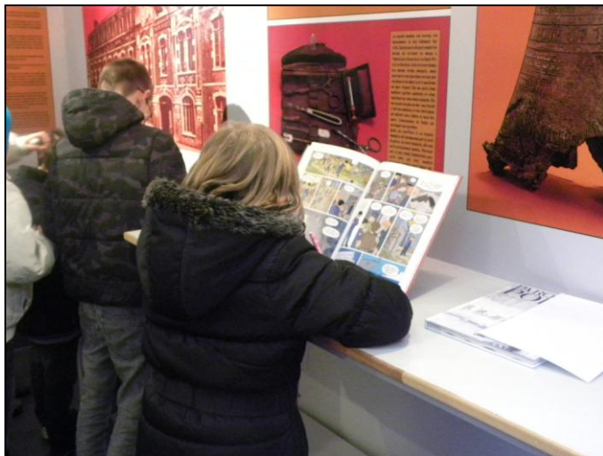
L'archivobus à l'école Fernand Buisson de Béthune

Un ancien véhicule a priori sans utilité, égaré au milieu des services techniques de la ville, a été recyclé par les Archives municipales dans l'idée d'y faire circuler des témoignages et des expositions itinérantes. Les commémorations du centenaire de la Première Guerre mondiale nous ont aidés à concrétiser le projet, au moins le thème général. Néanmoins, l'environnement du lieu, son espace limité, ses contraintes liées à sa mobilité, etc., nous ont amenés à une réflexion aussi importante sur le fond que sur la forme.