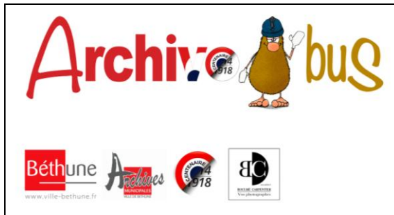
Un logo spécialement conçu pour l'archivobus © Ville de Béthune

À plus long terme, le but pourrait être plus ambitieux et irriguer toute l'agglomération béthunoise grâce à un partenariat avec l'office du tourisme de Béthune-Bruay, la notion de territoire faisant partie intégrante du projet initial.