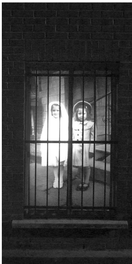
Loren Williams, 3669A, ruelle Saint-André / de Mentana (Le soir / At Night). Laterna magica , installation in situ , 24 septembre au 10 octobre 2010, Montréal. http://www.lorenwilliams.com/x-fr-accueil.html .

L'exposition présentée à Montréal sur l'avenue McGill College en 2013 visait à rappeler le triste sort des d'enfants ayant grandi dans des pensionnats autochtones et à faire réfléchir quant à la mission de ces institutions qui visait à les déposséder de leur culture. Pour atteindre cet objectif, et faire ce « devoir de mémoire », l'exposition était organisée autour de 24 photographies en noir et blanc provenant de différents centres d'archives. Chacune des images reproduites en grand format sur les panneaux d'exposition était accompagnée d'informations relatives à son origine ainsi que d'une légende servant à établir les faits et surtout les méfaits de cette vaste