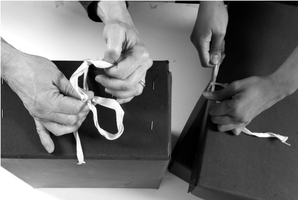
Archives nationales. Site Paris, Cliché Archives nationales