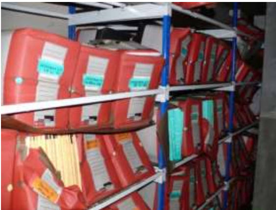
En absorbant l'eau, ils quadruplent de volume

Le constat d'état permettra d'évaluer les dégâts mais aussi la réussite du PSU.