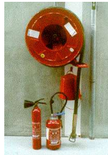
RIA et extincteurs