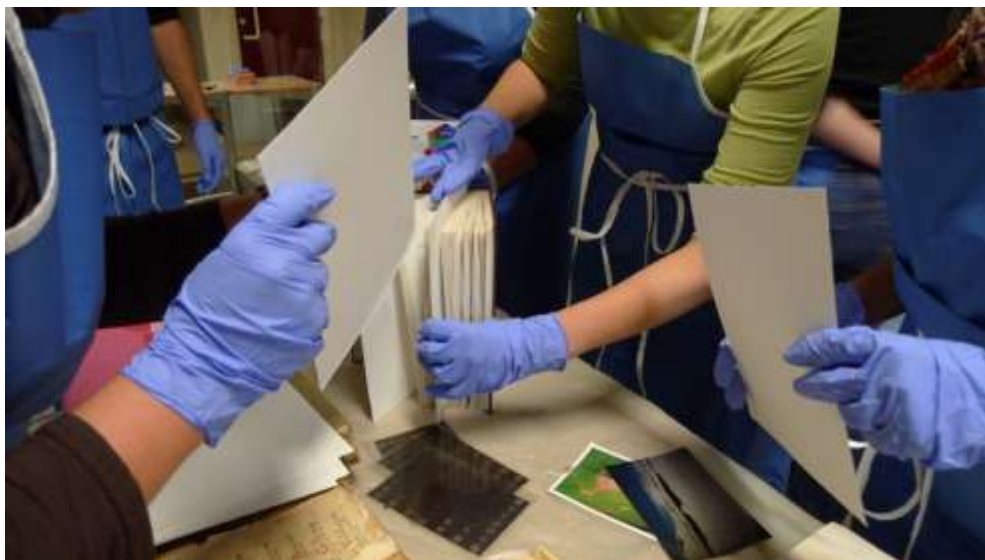
Direction générale des patrimoines Formation « Plan de sauvegarde » -Le séchage des collections inondées