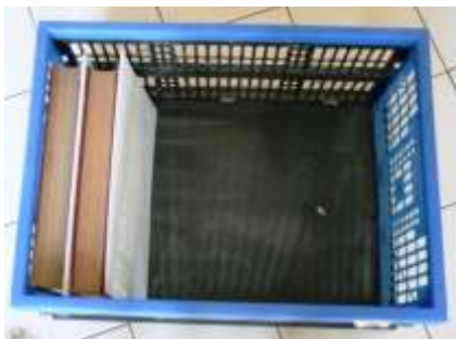
Evacuation des documents reliés