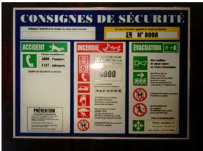
Consignes de sécurité

Vérifier que les consignes de sécurité sont bien affichées et contrôler l'état et l'adéquation des systèmes d'extinction aux matériaux et risques. A côté des collections, seuls les extincteurs à eau sans additifs devraient être utilisés.