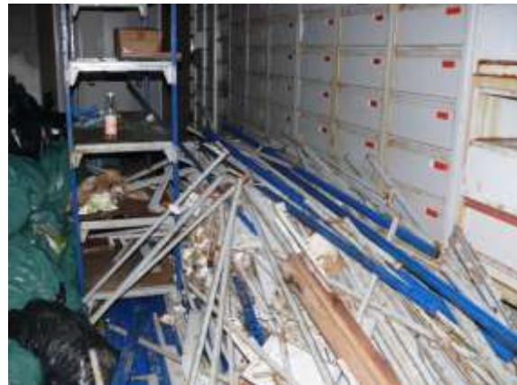
Le mobilier peut s'oxyder rapidement et est sacrifié pour sortir les fonds qui ont gonflé