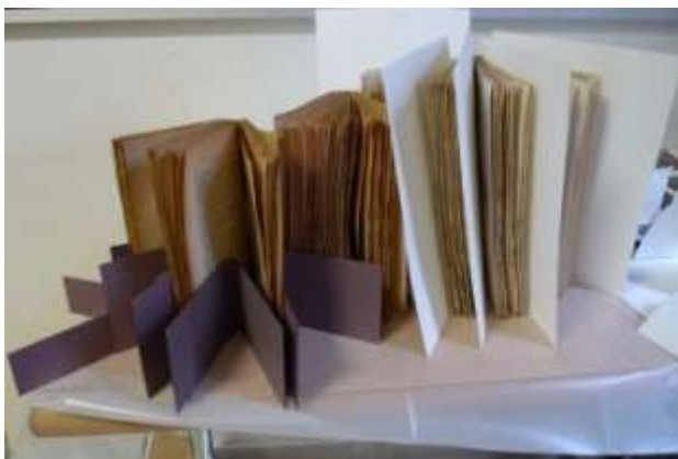
Séchage des ouvrages reliés