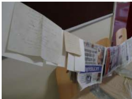
Séchage grands formats, journaux, calque...

Le feu entraîne l'utilisation de l'eau. Le tableau suivant résume les différentes modalités de traitement d'archives inondées.