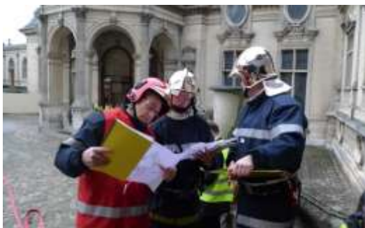
Examen plan d'urgence ; plans du bâtiment et localisation des œuvres sinistrées