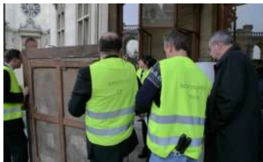
Identification des équipes : responsable, évacuation, constat, conditionnement, restauration, etc