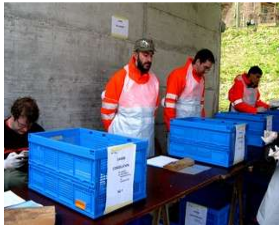
Postes bien définis-agents identifiables